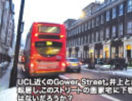
UCL近くのGower Street、井上と山尾はウリアムソン製菓店から撮影し、このストリートの画家宅に下宿した。伊藤も足しげく通ったのではないだろうか?

今回伊藤博文の経歴を追い、一人の人間がたどった七十年弱でこれほど多くのことを成し遂げたことに驚いた。ここに記した以外にも書ききれないほど伊藤の功績を上げ、西洋東洋へ向う。度も振り、最後まで