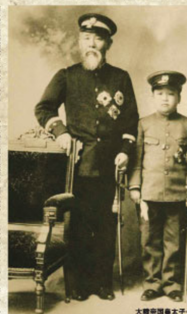
大韓帝國皇太子・李熙と伊藤

伊藤の経歴をたどると、これほど大砲を渡った明治人がいたことが驚愕する。殖産興業や教育令発布など明治政府の中心人物として内政に尽力しただけでなく、一八八二年(明治十五年)には明治天皇に憲法調査のための渡欧を命じられるなど、政府としての国際舞台としても振舞を振るう。八面六臂の活躍の場であった。ドイツ(フランクフルト)ベルリン、オーストリア(ウィーン)で憲法を学び、帰国後大日本帝国憲法草案制定に従事した。この渡欧の短期間であったが、再度渡英を訪れるようである。